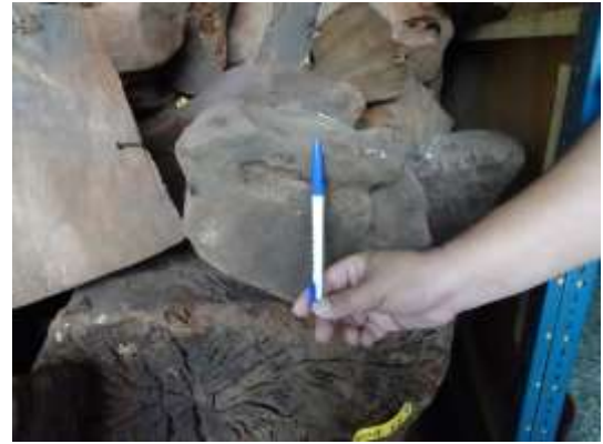
110 屏臟 7 號貯木現場