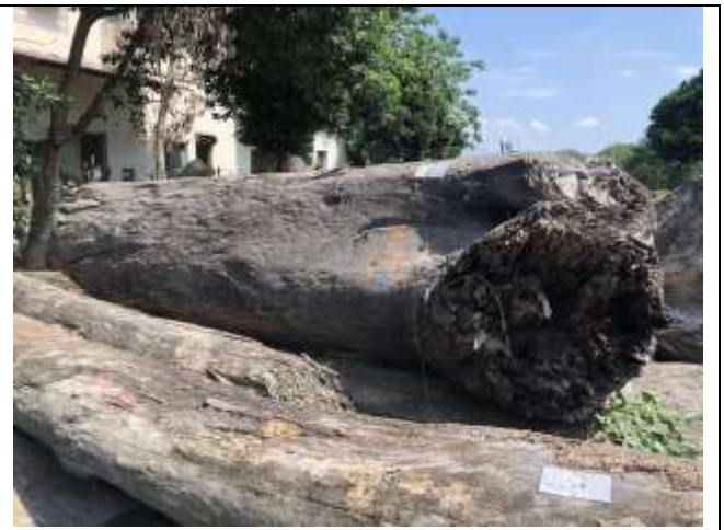
110 屏臟 8 號貯木現場