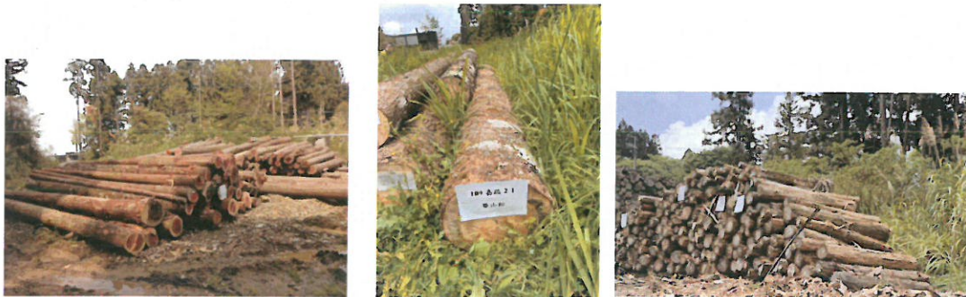
柳杉及華山松、紅檜堆置情形