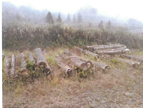
貯木場內標售柳杉及臺灣杉堆置情形